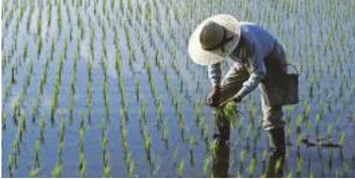
Рис является гидрофитом – полуназемным-полуводным растением. Адаптацией к такому образу жизни является способность дышать в основном листьями, а не корнем, как у наземных растений.

Существует три основных типа рисоводства.