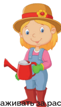
Ухаживать за растениями: