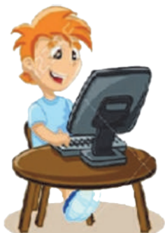
Играть в компьютерные игры: